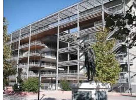
Vue coté Campus