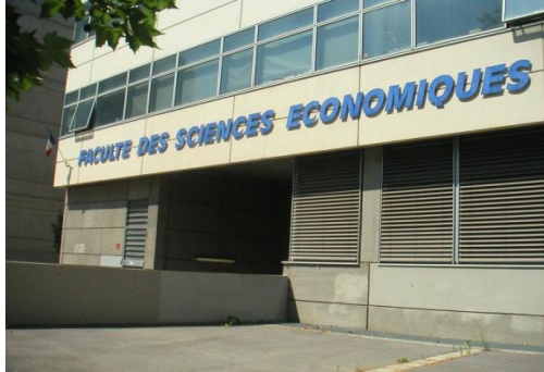
Vue Coté av R. Dugrand

Faculté d'Economie Av. Raymond Dugrand Campus Richter Bâtiment C Montpellier plan accès http://www.umontpellier.fr/universite/composantes/facultes/ufr-deconomie/