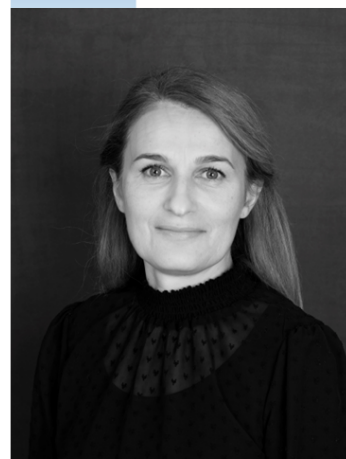
Pr. Lise BOURDEAU-LEPAGE